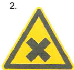
Nebezpečenstvo škodlivej alebo dráždivkej látky