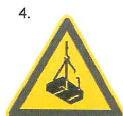
Nebezpečenstvo pádu alebo pohybu zaveseného bremena