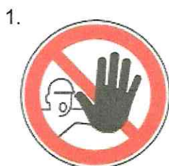
Nepovolaným vstup zakázaný (spolu so značkou č.2, 3 alebo 4 a príslušnou dodatkovou tabuľou)